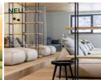
RUHERAUM bietet Ihnen eine entspannte und ruhige Atmosphäre, in der Sie neue Energie schöpfen können