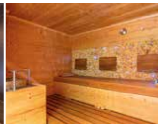
BIO KRÄUTERSAUNA in Niedrigtemperatur 60° Luftfeuchtigkeit 40-45° Wohltuend wirken die ätherischen Öle von Kamille, Fichtennadel, Heublumen und Minze