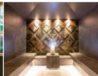
AROMADAMPFBAD mit WALDAROMEN 90° 45° Luftfeuchtigkeit