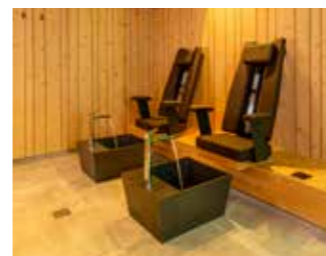
INFRAROTSTÜHLE mit KNEIPP-FUSSBECKEN wahrer Jungbrunnen für Wanderer