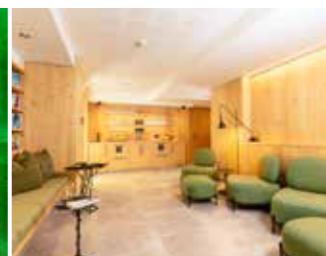
„LICHTUNG“ Hier trifft man sich bei einer Tasse Kräutertee oder einem erfrischenden Waldbeersaft