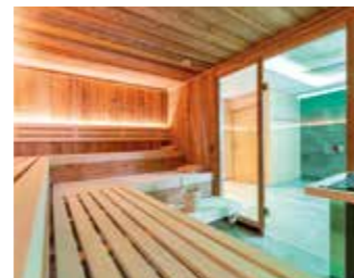
Klassische FINNISCHE SAUNA 90° ausgeführt in Fichtenholz