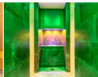
EISCRASHER & REGENDUSCHEN prickelnd und belebend, bringen das Herzkreislauf- system in Schwung