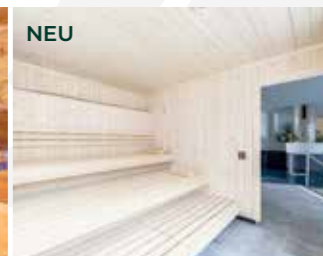
TEXTILSAUNA mit gemütlichen 70°C und einem wunderschönen Panoramablick verspricht sie unvergessliche Momente